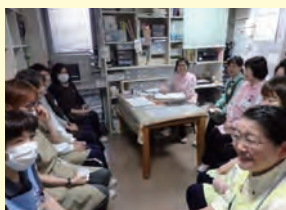
ミーティングの様子