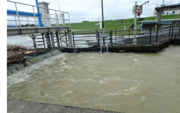
農業用の用排水路の増水状況

ため池の転落死亡事故は、釣り、水遊び等を行っているときに発生することが多くなっています。