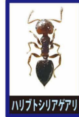
ハリトシリアゲアリ