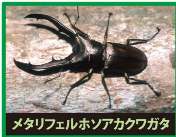
メタリフェルホンアカクワガタ

野外に出ると、日本のカブトムシやクワガタの餌やすみかをうばったり、交雑したり、昆虫の病気を広めたりします。