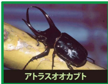
アトラスオオカブト