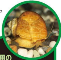
かんしょう用の ゴールデンアップルスネール

つかまえても、他の場所に持って行かないでね。飼っている貝は、池や川に放さないでね。