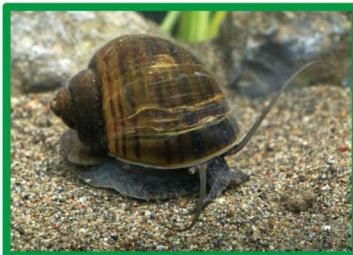
スクミリンゴガイ